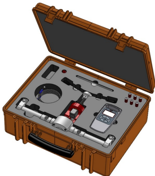
Coffret Explorer orange