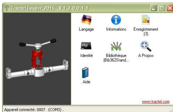
Fiche Technique HF 36/2/LPT/RW – 20/07/2015